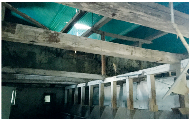
Vorher: Vieh- und Heuscheune, Stall